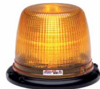
Leddaklamp ECE R65 Art.nr. 210-10-0172 optimale bedrijfsze- kerheid 5 jaar garantie op de ledunits