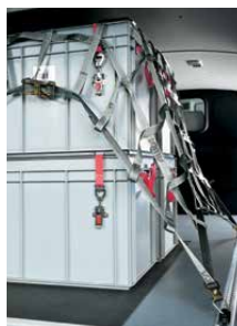
Ladingzekeringsnet 1200 x 1800 mm Rondom voorzien van bevestigingspunten voor trekbanden en haken. Art.nr. 101014