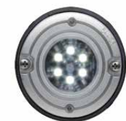
Ledinterieurverlichting Art.nr. 210-30-0307 360 lumen, aluminium basis 5 jaar garantie op de ledunits