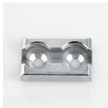
Vloeroog Geanodiseerd aluminium Art.nr. 106153