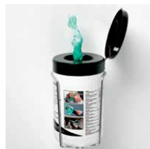
Vochtige reinigings- doekjes Inhoud 50 doekjes Art.nr. 100943 Wandhouder Art.nr. 100945