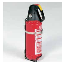
Brandblusser 2 kg Incl. wandhouder Art.nr. 100912

Kijk voor meer informatie op www.aluca.nl