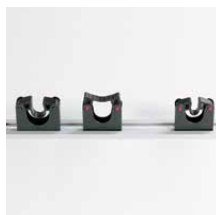
Gereedschapsklemmen Gereedschapsklem 20-30 mm Art.nr. 101048 Gereedschapsklem 30-40 mm Art.nr. 101049 Bevestigingsrail 500 mm Art.nr. 101050 Bevestigingsrail 900 mm Art.nr. 101051