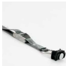
Spanband met fitting en gesp, 1 m. Art.nr. 100982 en gesp, 2 m. Art.nr. 100983