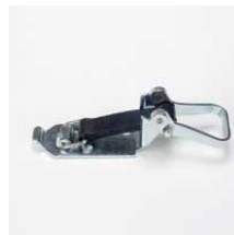
Spanvergrendeling Verzinkt staal Lengte rubberband 90 mm Art.nr. 100893