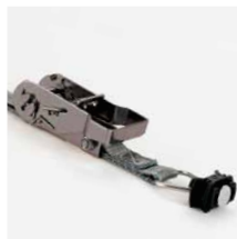
Spanband met fitting en ratelmechanisme, 1 m. Art.nr. 100979 en ratelmechanisme, 2 m Art.nr. 10 0980