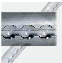
Vliegtuigrails Aluminium, 990 mm Art.nr. 100963 Aluminium, 1490 mm Art.nr. 100964