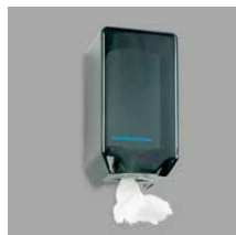
Papierrolhouder Art.nr. 100938 Navulling 9 papierrollen Art.nr. 100939