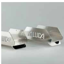
Aluminium slanghouders Slanghouder SH25 Breedte 250 mm Art.nr. 105614 Slanghouder SH32 Breedte 320 mm Art.nr. 105616