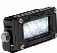
Ledwerkklamp Art.nr. 210-99-0144 1100 LUMEN 5 jaar garantie op de ledunits