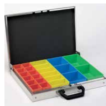
Aluminium koffer met inzetbakjes Indeling als afb. 1 Art.nr. 100921 Indeling als afb. 2 Art.nr. 100922 Indeling als afb. 3 Art.nr. 100923