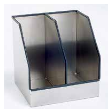
Ordnerhouder Aluminium, 2-vaks Art.nr. 100895