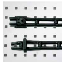
Ladderband 30 mm breed, met 2 bevestigingsdoppen, 1 m. Art.nr. 100985